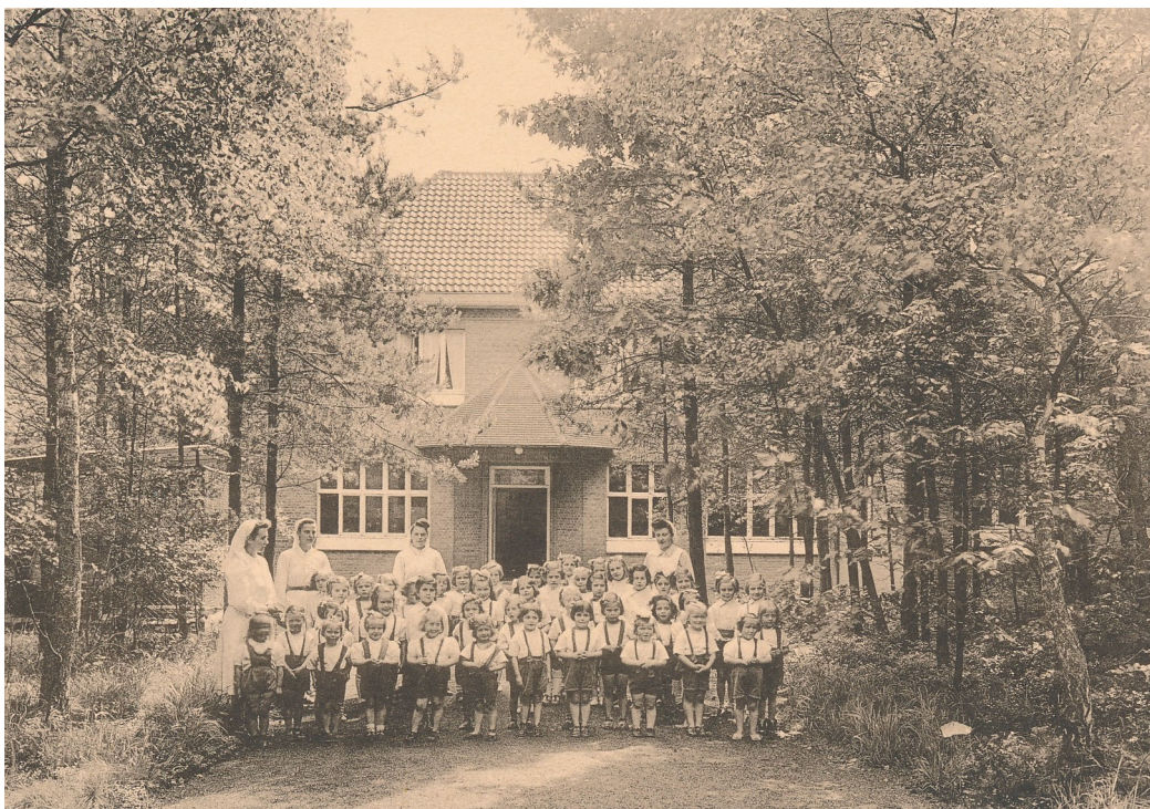
Twee zichten op het kindersanatorium (rond 1950?).