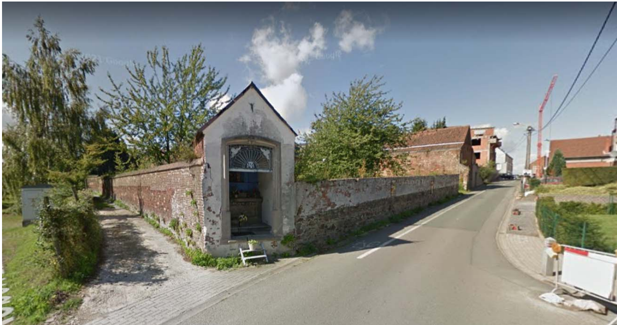
Beeld van Google Street View, voor de bouw de residentie “De Stroppen”.

tewerk voor een bevolking van 40.650 inwoners en een oppervlakte van 42 km 2 ) en vertrekken ongeveer 50 bedrijfswagen op hun dagelijkse onderhoudsbezigdheden over het hele grondgebied.