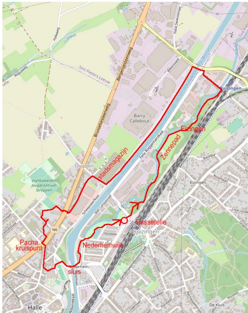
Parcours van de wandeling in rood, startpunt is het cirkeltje. Achtergrond: Open Street Map.

Vertrekpunt: Buizingen, Nederhempark, Spoorwegstraat ter hoogte van de "Passerelle" (zijde kanaal).